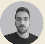
سیحان مسلمان واحد داروخانه مدل

از جمله وظایف این کمیته شامل: - آشناسازی دانشجویان با مباحث مطرح در آموزش داروسازی - هدفدار نمودن فعالیت های آموزشی دانشجویی و شرکت در جشنواره ها - ایجاد پل ارتباطی بین دانشجویان و مسئولین آموزشی دانشکده جهت انتقال مشکلات آموزشی - برنامه ریزی و پیشنهاد همکاری برای اجرای طرح های پژوهشی و مطالعاتی در حوزه آموزش داروسازی